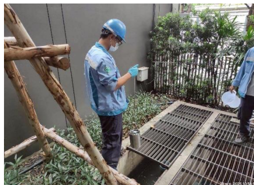
รูปที่ 3.5.5-1 การเก็บตัวอย่างน้ำของระบบบำบัดน้ำเสีย