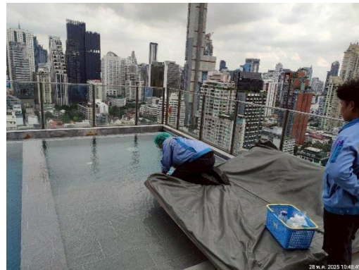
รูปที่ 3.5.3-1 การเก็บตัวอย่างน้ำบริเวณสระว่ายน้ำ