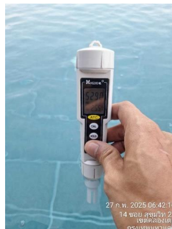
รูปที่ 3.5.3-2 การตรวจวัด pH, Cl 2 สระว่ายน้ำ