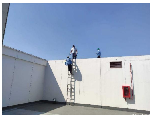
รูปที่ 3.5.4-1 การเก็บตัวอย่างน้ำของระบบน้ำใช้